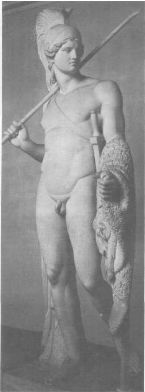
Na época de Kierkegaard, a cultura dinamarquesa contribuiu decisivamente para o neoclassicismo nas artes, através da escultura de Thorvaldsen. (Museu Thorvaldsen, Copenhague.)

intensidade do dever, de tal modo que sua consciência esteja plenamente garantida da eterna validade de seu ser.